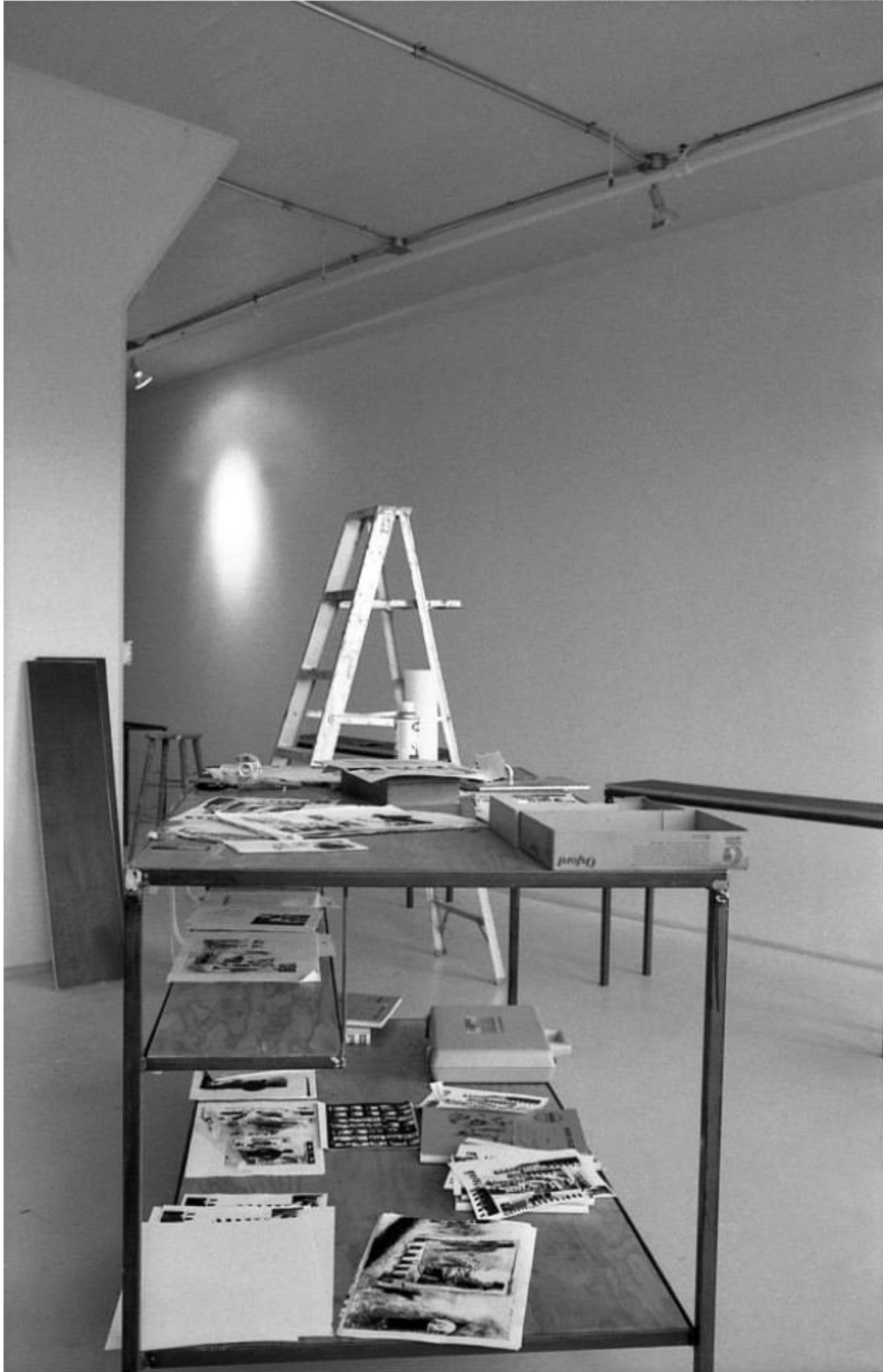
La table de travail