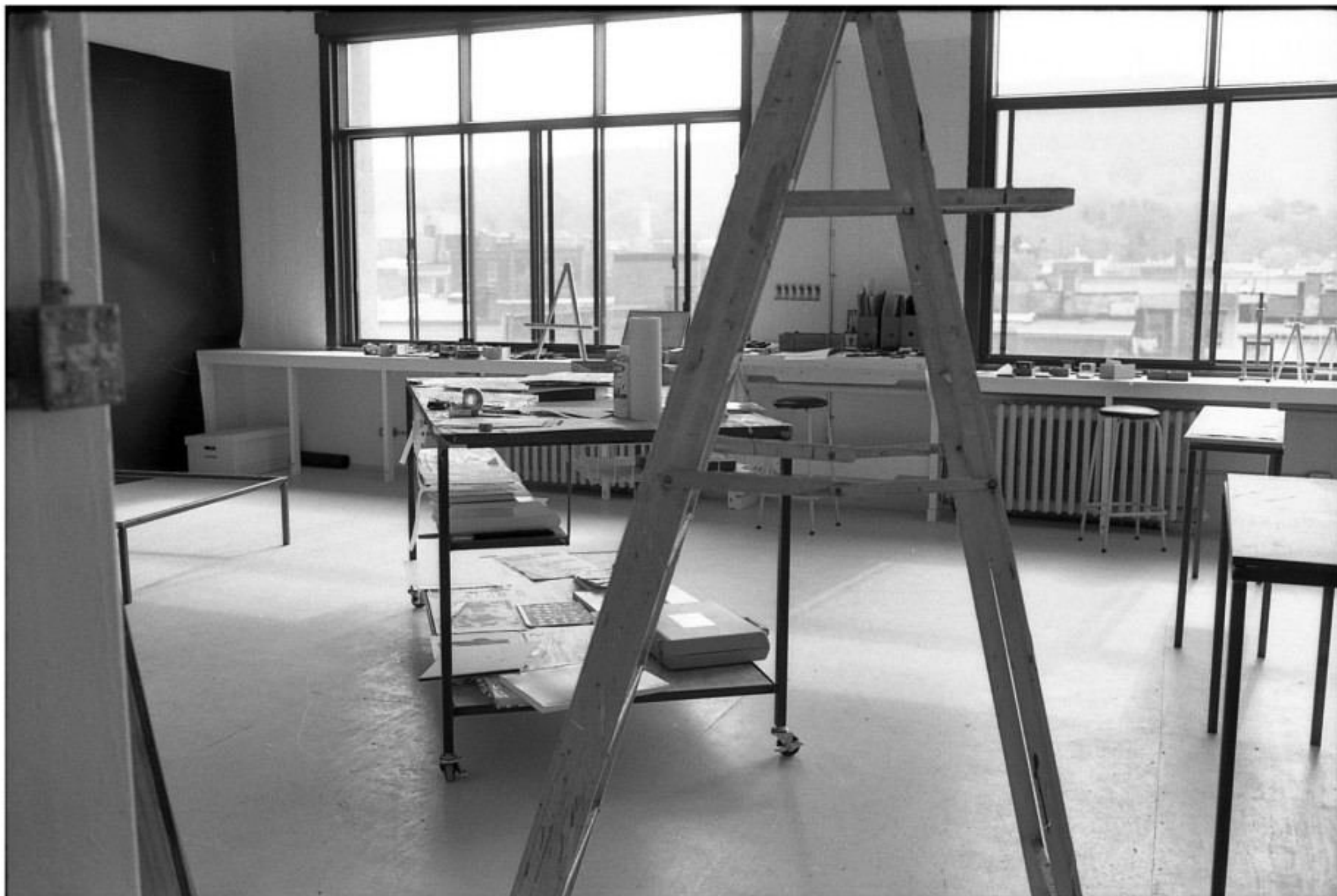
lieu de convergence