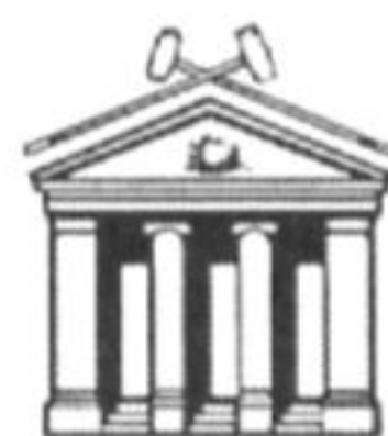
Hôtel des Encans

À toutes les galeries et tous les collectionneurs qui ont offert des oeuvres ou des dons pour cette vente. To all the galleries and collectors who have contributed works of art and donations for this sale.