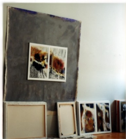
Denyse Gérin 2001 L'atelier (vue partielle) photo couleur

C'est donc à partir d'un doute et de cette liberté, que se sont élaborées les œuvres de l'installation présentées à la Galerie d'Art de Matane.