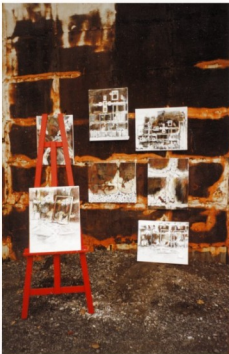
Denyse Gérin 1999 « Le mur de la ruelle » (détail) photo

Denyse Gérin 4060 boul. St-Laurent # 607B Montréal (Québec) H2W 1Y9