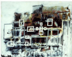
Denyse Gérin 2000 «Aller-retour 16» médium mixte / toile, 41x51cm

Un mur de ruelle patiné par le temps n'est beau que pour l'artiste qui le fait revivre par son imagination. Il s'agit bien ici d'images réelles, recréées, réinventées et «faites main».