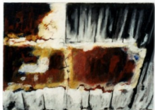
Denyse Gérin 2000, «Aller-retour 8» médium mixte/toile 92x61cm