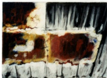
Denyse Gérin 2000, «Aller-retour 8» médium mixte/toile 92x61cm